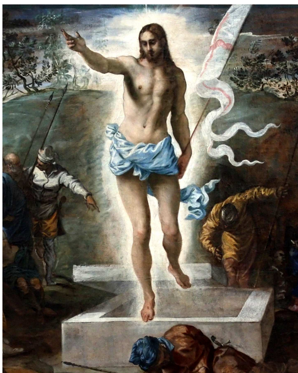
Tintoretto, La risurrezione (particolare)