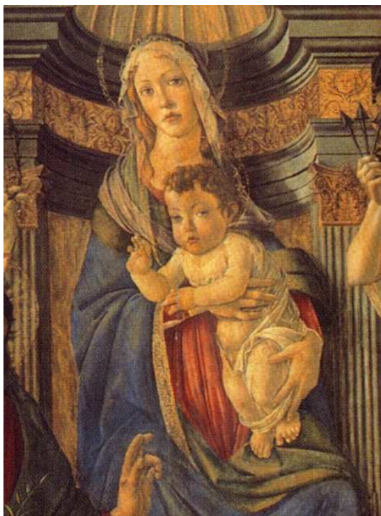
Sandro Botticelli, Pala di San Barnaba (particolare)

dersi in essi, a saperli superare : "Una vita senza sfide non esiste e un ragazzo o una ragazza che non sa affrontarle mettendosi in gioco, è senza spina dorsale!" Carissimi: sta a noi tutti, comunità parrocchiale, ciascuno nel suo ruolo, ad essere di esempio ai nostri giovani , spingendoli verso la strada che il Signore, attraverso Maria, ci indica e vuole per noi, per poter arrivare un giorno a contemplare Dio 'faccia a faccia'.